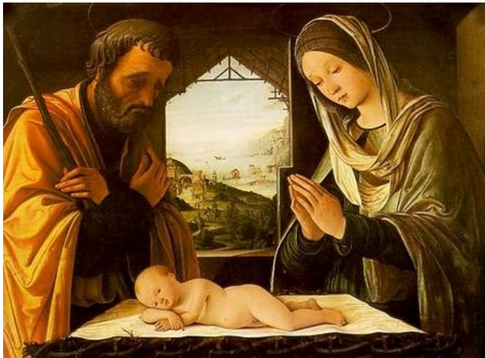
Lorenzo Costa 1460-1535 au musée des beaux arts de Lyon