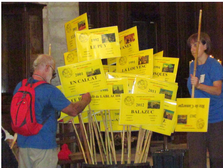
La diversité des routes de saint Gilles représentées pour le 30e anniversaire