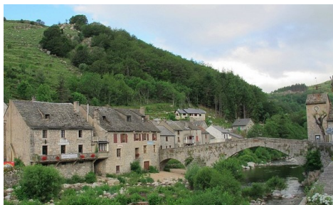
Le Tarn à Pont de Montvert

Le voyage de Stevenson n'aurait sans doute pas été le même sans « Modestine » l'ânesse avec laquelle Robert-Louis Stevenson finit par tisser au long de son voyage des liens affectifs forts, changeant son regard sur lui-même, tout en cheminant sur sa Cévenne traversant le Velay, le Gévaudan et toute la Lozère.