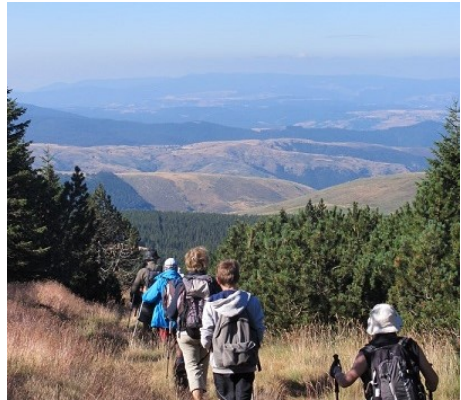
En marche dans la belle nature