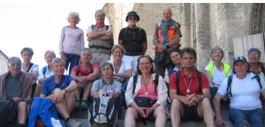
Chemins de saint Gilles

Une Route des Papes impose un hommage à Avignon, où nous avons visité le Palais des papes puis apprécié une magnifique paella dans la cour ombragée d'une pèlerine de longue date. Via Tarascon, nous avons terminé notre route à St Gilles pour ensuite nous séparer pleins de gais et puissants souvenirs, et