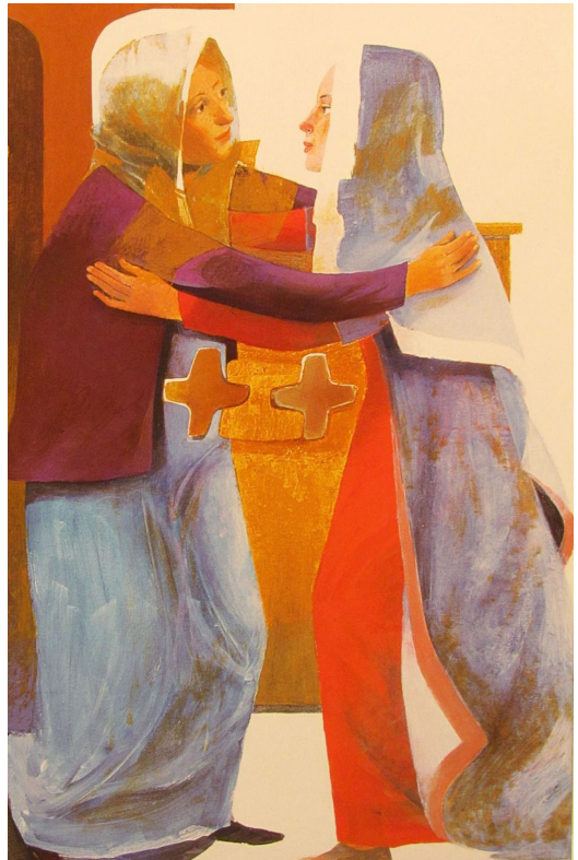
Joie et Espérance

Bien sûr, il reste toujours des choses à améliorer ; mais nous avons beaucoup développé nos contacts avec les équipes