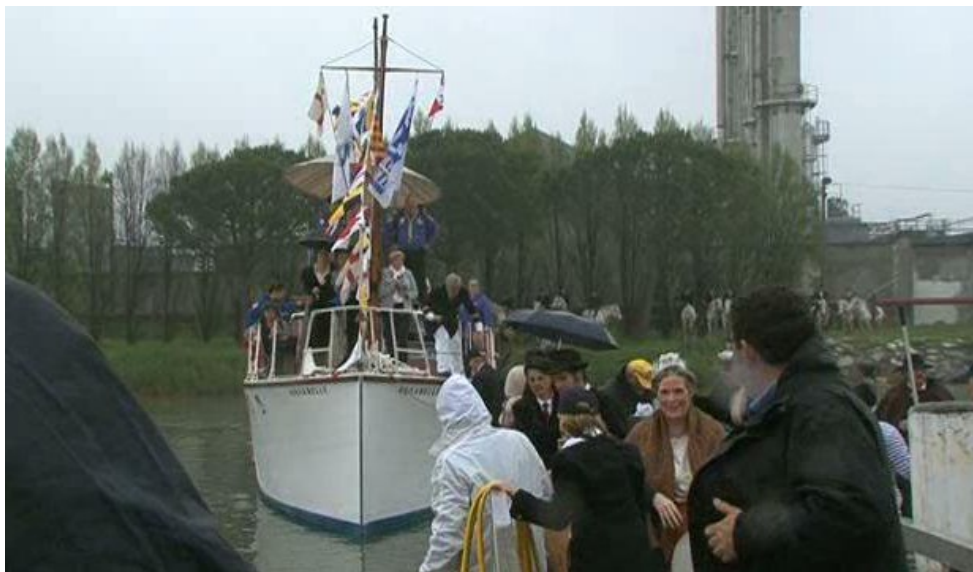
900e anniversaire : arrivée des reliques de Toulouse au port de Saint-Gilles