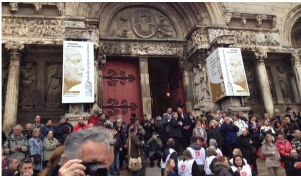
900e anniversaire : arrivée des reliques à l'abbatiale de Saint-Gilles