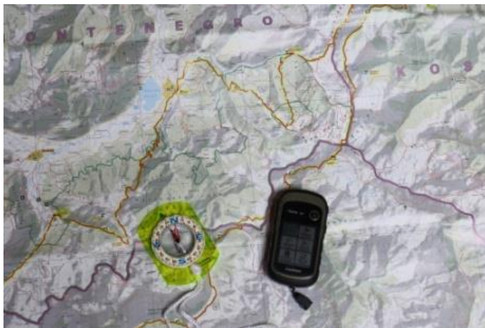
Carte, boussole et GPS

Sur les 15 pèlerins réunis à Lyon samedi 21 et dimanche 22 janvier pour œuvrer sur les projets 2023, neuf participants se sont concentrés sur les pratiques du guidage, six autres sur l'animation spirituelle des chemins de l'année.