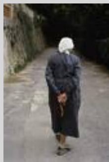
Chemins de saint Gilles

fier de l'adage : « tous les chemins mènent à Rome »...puisqu'il est sûr que ce n'est pas à Rome que nous voulons aller, mais au désert !