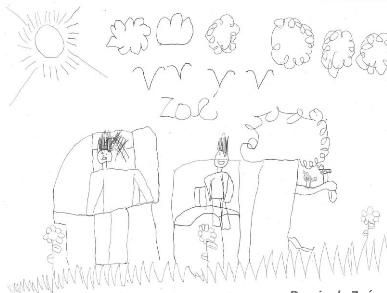
Dessin de Zoé