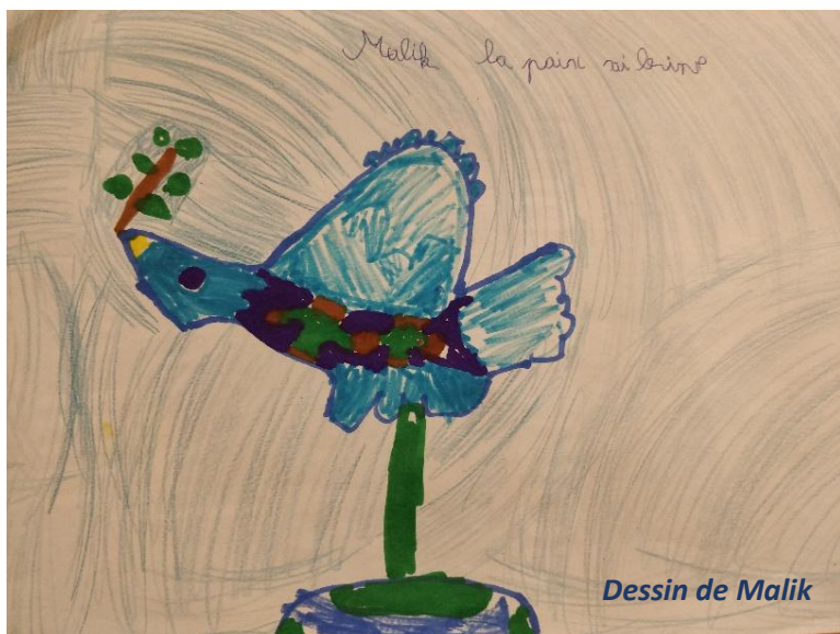
Dessin de Malik