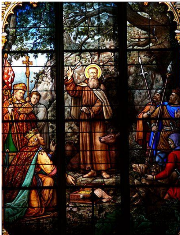
Vitrail de saint Gilles, église Saint-Gilles du XI e siècle à l'île-Bouchard (Indre-et-Loire)

ASSOCIATION DES CHEMINS DE SAINT-GILLES Évêché de Nîmes 3, rue Guiran BP 81455 30017 Nîmes Cedex 1 https://cheminstgilles.fr asso@cheminstgilles.fr