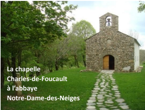
La chapelle Charles-de-Foucault à l'abbaye Notre-Dame-des-Neiges

À l'abbaye, nous serons logés cinq nuits dans la maison de Zachée, petit-déjeuner et dîner fournis (sauf dîner du mardi où nous serons autonomes). Le déjeuner sera pris à l'extérieur.