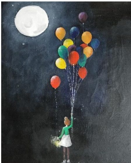
Tableau de Charline Bosc-Walter

« Ce qui m'étonne, dit Dieu, c'est l'espérance. Et je n'en reviens pas. Cette petite espérance qui n'a l'air de rien du tout. Cette petite fille. Immortelle. Car mes trois vertus, dit Dieu. Les trois vertus, mes créatures. Mes filles, mes enfants. Sont elles-mêmes comme mes autres créatures. Des êtres bien différents. L'Espérance est une petite fille de rien du tout. Qui est venue au monde le jour de Noël de l'année dernière. Elle est encore toute neuve. Elle n'a encore jamais servi. Et des trois, c'est celle qui plaît à mes autres créatures. Elle n'a point de cœur gros, dit Dieu. Et c'est celle pourtant qui vivra le plus longtemps. Car mes trois vertus, dit Dieu. Les trois vertus, mes créatures sont elles-mêmes comme mes autres créatures. Ce sont des femmes. La Foi est une épouse fidèle. La Charité est une mère. Une mère ardente, pleine de cœur. Ou une sœur aînée qui est comme une mère. Mais l'Espérance est une petite fille de rien du tout. Qui est venue au monde le jour de Noël de l'année dernière. Elle est encore toute neuve. »