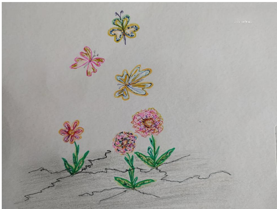
Tableau de Christiane Leblanc - Tu renaîtras de la poussière